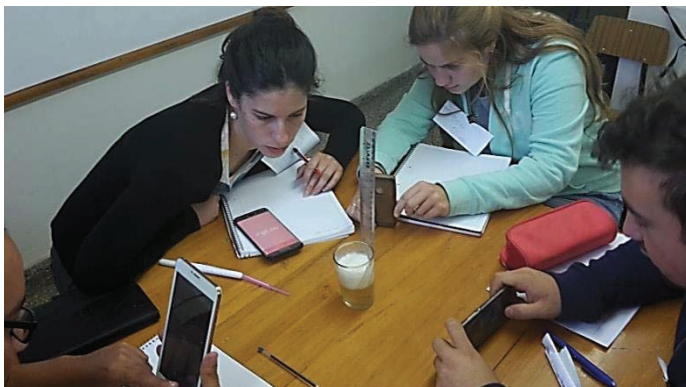
Figura 6. Estudiantes experimentando, recolección de datos experimentales.

El equipamiento es: un vaso cilíndrico de sección uniforme, una lata de cerveza y un teléfono inteligente o cámara digital. Opcionalmente se puede usar una regla de referencia y un cronómetro para registrar el tiempo asociado a cada fotograma. Se vierte la cerveza en el vaso tratando de lograr una buena espuma. Comenzamos a fotografiar a tiempos regulares, Figura 1. La distancia de la cámara al vaso, debe permanecer fija durante el experimento. A medida que pasa el tiempo las fotos se toman más espaciadas en tiempo hasta