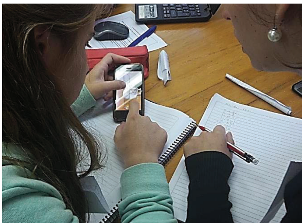
Figura 7. La pantalla del teléfono inteligente permite extraer información de la altura de la espuma de cerveza. Dos estudiantes miden usando la pantalla del teléfono y registran los datos.

Cada grupo con sus datos generan un gráfico de la altura en función del tiempo, en escala lineal y semilogarítmica.